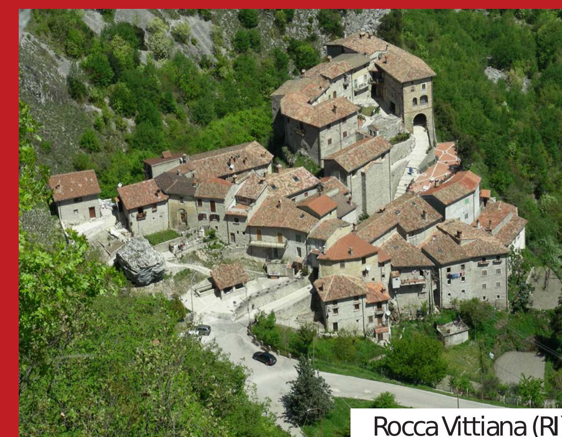
Rocca Vittiana (RI)