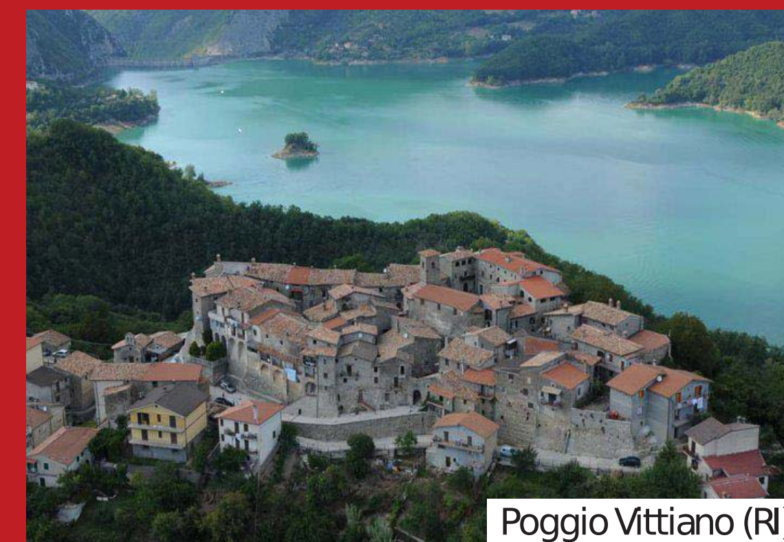
Poggio Vittiano (RI)