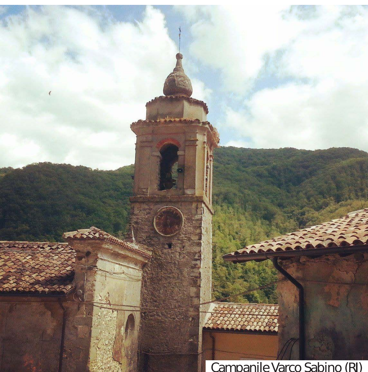
Campanile Varco Sabino (RI)